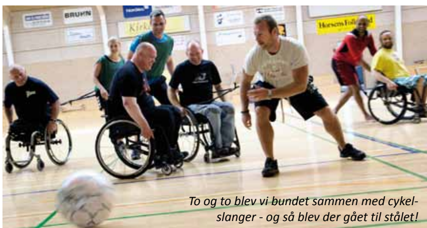
To og to blev vi bundet sammen med cykelslanger - og så blev der gået til stålet!

Jeg må derfor til indledningen replikere: At det hele faktisk er så fedt i Jylland - og i særdeleshed på Egmont i uge 30, som jeg gerne tager et gensyn med.