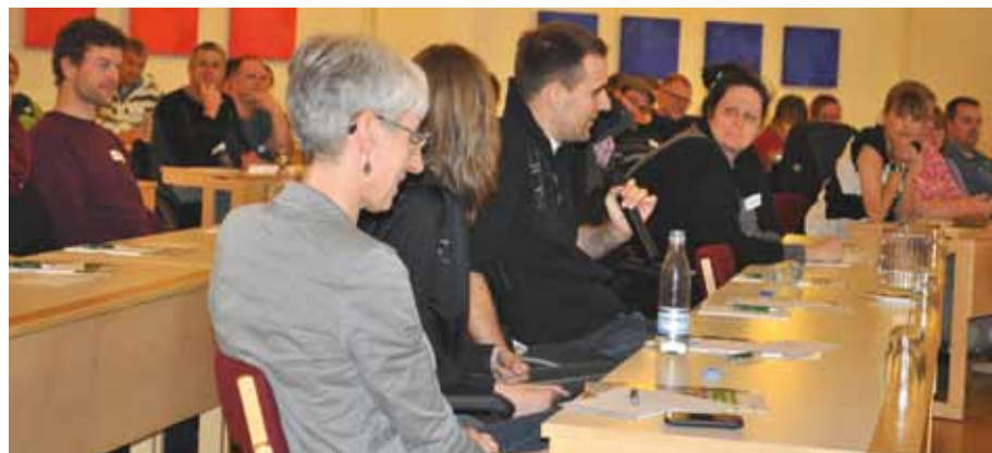
Der var mange indspark undervejs fra deltagerne, der delte ud af egne erfaringer med afhængighed af at modtage hjælp.

- Angsten kan være forbundet med at blive udelukket for fællesskabet, men