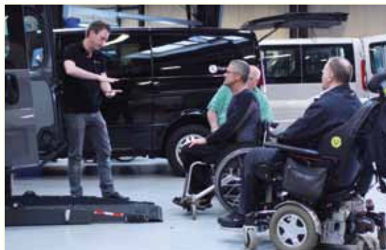
Efter generalforsamlingen stillede Handicares konsulenter op til snak og afprøvning af de udstillede biler, og det benyttede mange af generalforsamlingens deltagere sig af.