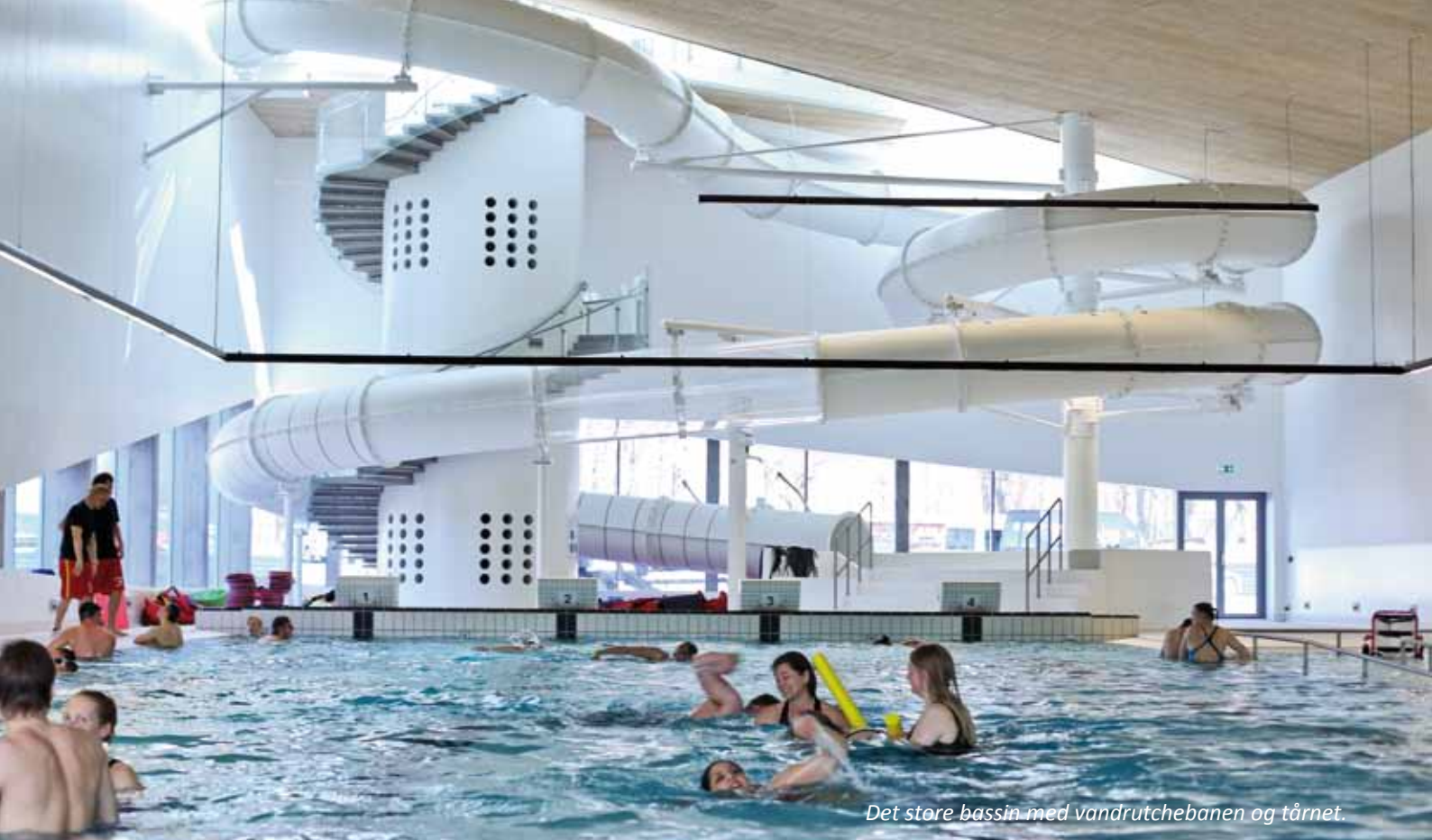
Det store bassin med vandrutchebanen og tårnet.