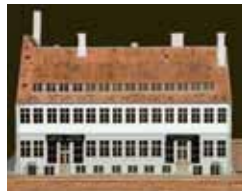
In this, the Mintmaster's Mansion underwent a heavy-handed conversion which, among other things, resulted in the disappearance of the finely carved beam ends in made them fit the planned neoclassical style.

Thus the old Mintmaster's Mansion, originally built as an imposing single-family home for the King's mintmaster, had now been downgraded to an ordinary block of flats, while the rest of the large property housed an early industrial business.