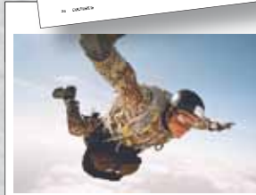
Frit fald for faldkærmens udførelse over Frankrig. Umiddelbart efter billedet er taget, kommer jeg i det skæmmende spind.

Vil opleve springet uden døg og videnskabelige erfaringer til kropssets faldkærmsektion. Jeg springer derfor med en videofotograf, som optager hele springet.